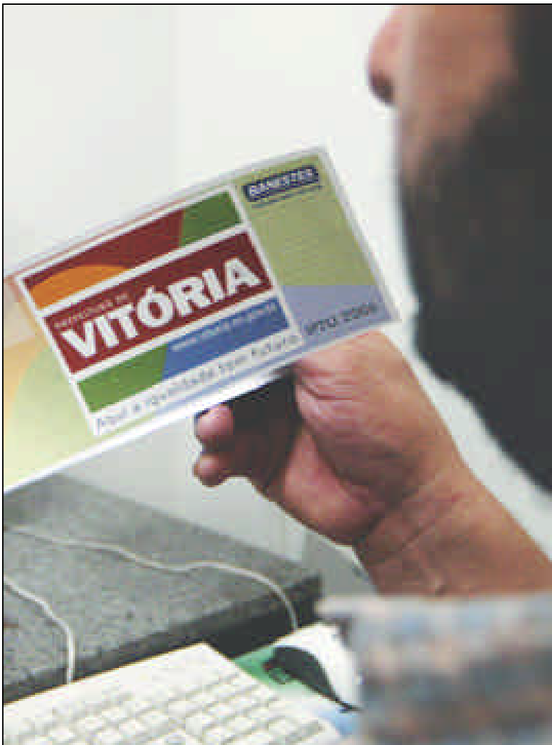
Carnê do IPTU, que veio com reajuste de até 176%

“Quando a prefeitura processa os cálculos do IPTU, o operador pode cometer algum erro na posição de uma vírgula, por